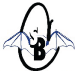
FUNDAȚIA SPEOLOGICĂ "Club Speo Bucovina"